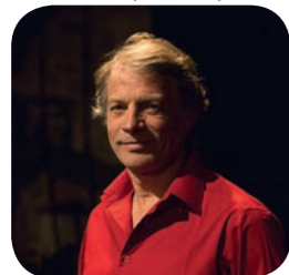
Tom TOREL Auteur, Compositeur, Interprète